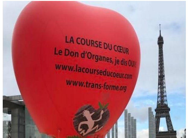
La course du Cœur