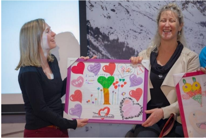
L'association des enfants