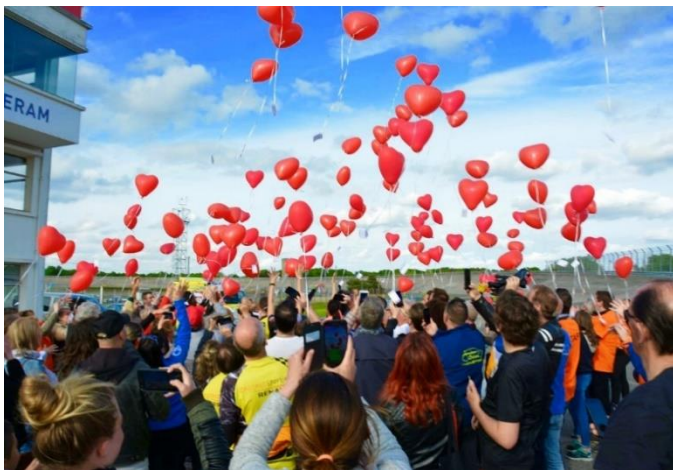
Rdv automobile à Montlhéry