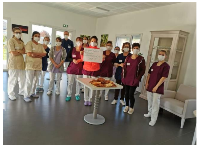
Des équipes médicales engagées