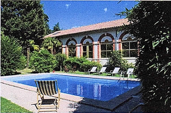
Hôtel Les BELLUGUES