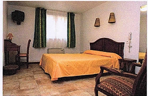
Chambre Les 4 SOURCES

Dotée d'une belle renommée , cette épreuve attire des Autos et Pilotes et copilote qui ont marqués Années 1960 à 1980