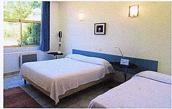
Chambre Hôtel Les BELLUGUES