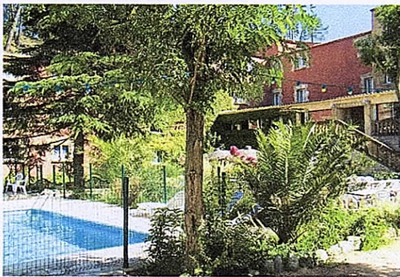
Hôtel Les 4 SOURCES